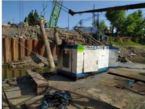
Gambar 8. Genset

Genset pada pemancangan di atas air (waterborne pile driving) digunakan sebagai sumber daya listrik untuk mengoperasikan peralatan pemancangan, termasuk vibrator pile driver, di atas permukaan air. Proses pemancangan di atas air sering digunakan dalam konstruksi jembatan, dermaga, atau struktur lain yang memerlukan pemancangan tiang pancang di lingkungan air.