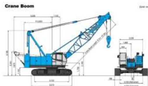
Gambar 3. Sketsa Crane 7055