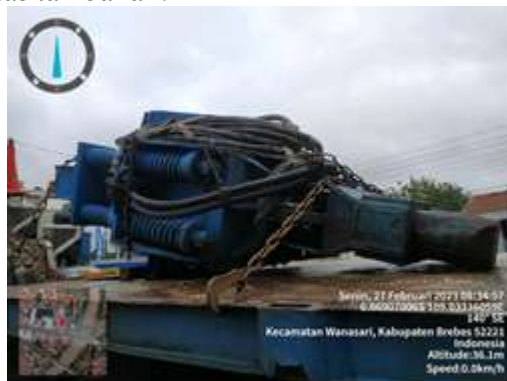
Gambar 6. Vibrator Pile Driver

Vibrator pile driver untuk pemancangan Steel Site Pile memiliki beberapa komponen utama, termasuk: