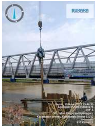
Gambar 9. Pemasangan SSP

Sheet pile dengan material ini paling sering dipakai karena memiliki kekuatan merata, berat sendiri yang relatif ringan dan waktu penggunaan yang relatif tahan lama. Sheet pile jenis ini memiliki sifat korosif, oleh karena itu penggunaannya perlu dipertimbangkan dengan baik. Interlok pada tiang turap dibentuk seperti jempol-telunjuk atau bola-keranjang untuk hubungan yang ketat untuk menahan air.