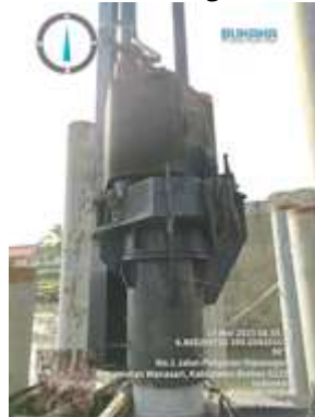
Gambar 5. Flying Hammer