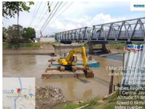
Gambar 12. Normalisasi Sungai

Normalisasi sungai adalah proses yang melibatkan perubahan atau modifikasi alami sungai untuk menciptakan kondisi yang lebih stabil dan terkendali. Normalisasi sungai sering dilakukan dalam proyek konstruksi jembatan yang melibatkan penggunaan landasan ponton.