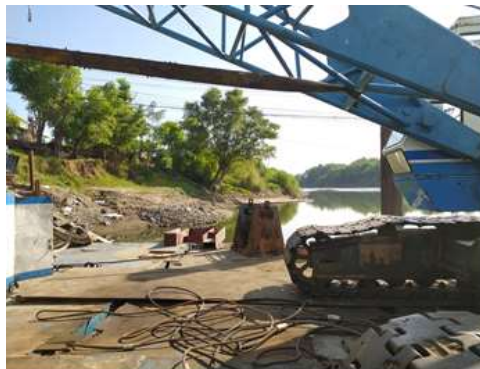
Gambar 7. Hand Winch

Hand Winch pada ponton adalah jenis mekanisme penggerak yang digunakan untuk mengoperasikan katrol sling ponton secara manual. Hand winch adalah perangkat yang terdiri dari drum bergerigi yang dioperasikan dengan menggunakan tangan atau tuas untuk membuka atau mengencangkan tali sling.