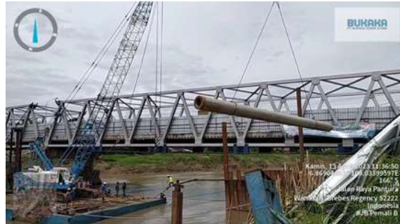
Gambar 15. Pemindahan Spun Pile