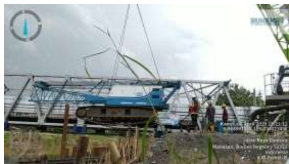
Gambar 14. Pемindahan Crane

Proses pemindahan Crane ke Ponton untuk persiapan pemancangan di atas air.