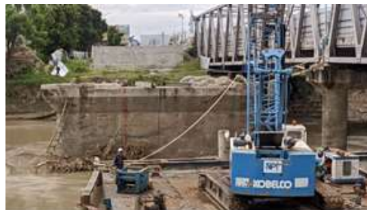
Gambar 10. Posisi Guide Beam

Melakukan pemasangan Guide Beam yang berfungsi sebagai penahan agar Spun Pile dapat berdiri tegak pada saat dilakukan pemancangan.