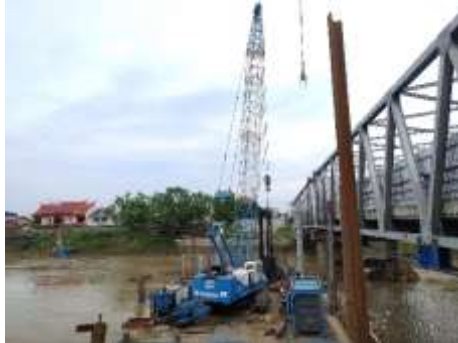
Gambar 2. Crane

Dalam proyek Pergantian Jembatan CH Pemali ini terdapat 2 Crane utama yang beroperasi dalam pemancangan di atas air :