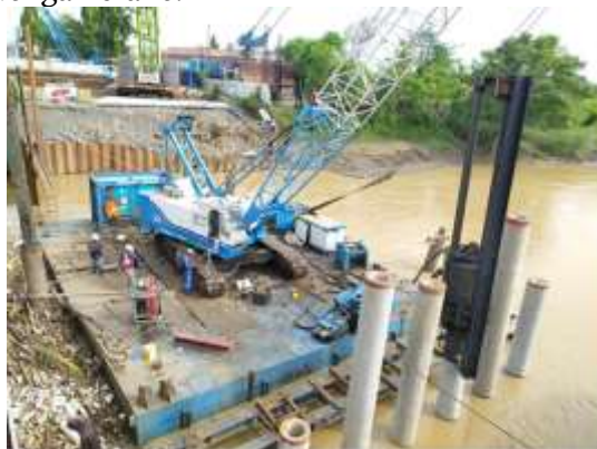
Gambar 1. Ponton