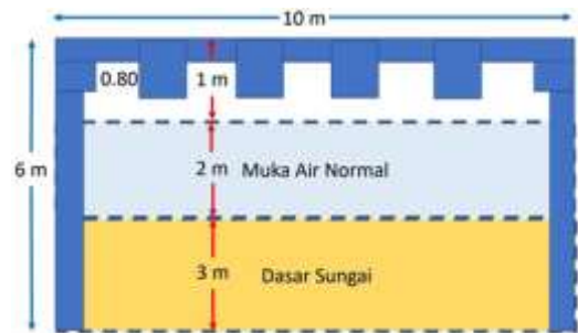
Gambar 11. Sketsa Guide Beam

Keterangan : Pondasi Guide Beam dipancang masuk 3 m ke dalam dasar sungai