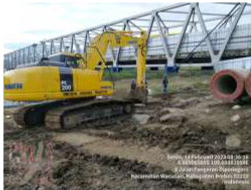
Gambar 13. Mobilisasi Peralatan

Mobilisasi peralatan merupakan peralatan apa saja yang akan di pakai dalam mengerjakan pemancangan dan persiapan peralatan tersebut harus dilakukan secepat dan seefisien mungkin agar pemancangan berjalan lancar.